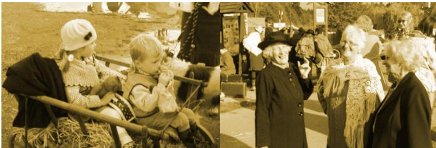
Běh Járy Cimrmana – zážitek pro všechny generace

V prvním roce se objevila zpráva o konání závodu na titulní straně Kladenských novin. Už jsem tušil, že závod bude hodně slavný, lze očekávat alespoň stohlavou účast a potřást rukou mi přijdou i herci Divadla Járy Cimrmana, protože Kladenské noviny čtou a tohle si rozhodně ujít nenechají. Přiblížil se očekávaný den. Sledoval jsem předpověď počasí. Proto, že mám rád extrémy, zaujala mě možnost, že by mohlo sněžit, což předpověď připouštěla.