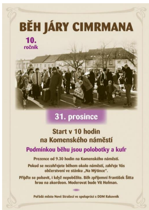
Také v Novém Strašecí už oslavili jubileum

Odpověď na tuto otázku zaměstnávala a zaměstnává mnohé vědce i spisovatele vědeckofantastických románů. Naši kufroběžci odpověď znají. Nejsme sami. Ve vesmíru ani na zeměkouli. V Čechách, ba i v okrese Kladno lze najít závody spojené stejnou myšlenkou. Inspirací pro vznik kladenského Běhu Járy Cimrmana byla kdysi mimo rozcestí Na Cimrmanském i podobná akce svazáků z Jirkova u Chomutova. Později se něco podobného konalo třeba u Třeboně. Vyloženě spráteným bych nazval Běh Járy Cimrmana v Novém Strašecí. Jednoho ročníku jsem se s rodinou zúčastnil. Se starostou města, které akci pořádá, nás spojuje účast na běžeckých závodech. Ten závod, je jiný, koná se na Silvestra přímo na náměstí, ale spojuje nás recese a „smysl pro nesmysl“. Kladenský závod má ale delší historii a právem se pyšní titulem Nejstarší kufroběžecký závod na Kladensku.