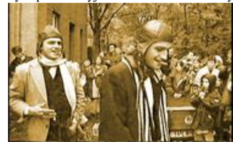
Zlatý špaček je už dlouhá léta vytouženou cenou pro kufroběžce kuřáky

A tisknout jednu ze stránek přímo v cíli je komplikované. Jak to tedy udělat? Pro podobnou publikaci k 30. výročí už řešení mám. Použijeme výkřik techniky posledních let, který nahradí bývalé tablety a ipady a způsobí zastavení jejich výroby. Ano, mám na mysli internetový papír, který připojí tištěnou brožuru k internetu a stáhne aktuální verzi dokumentu a ten po odpojení antény zůstane dále vytištěn, jako by právě vyjel z laserové tiskárny.